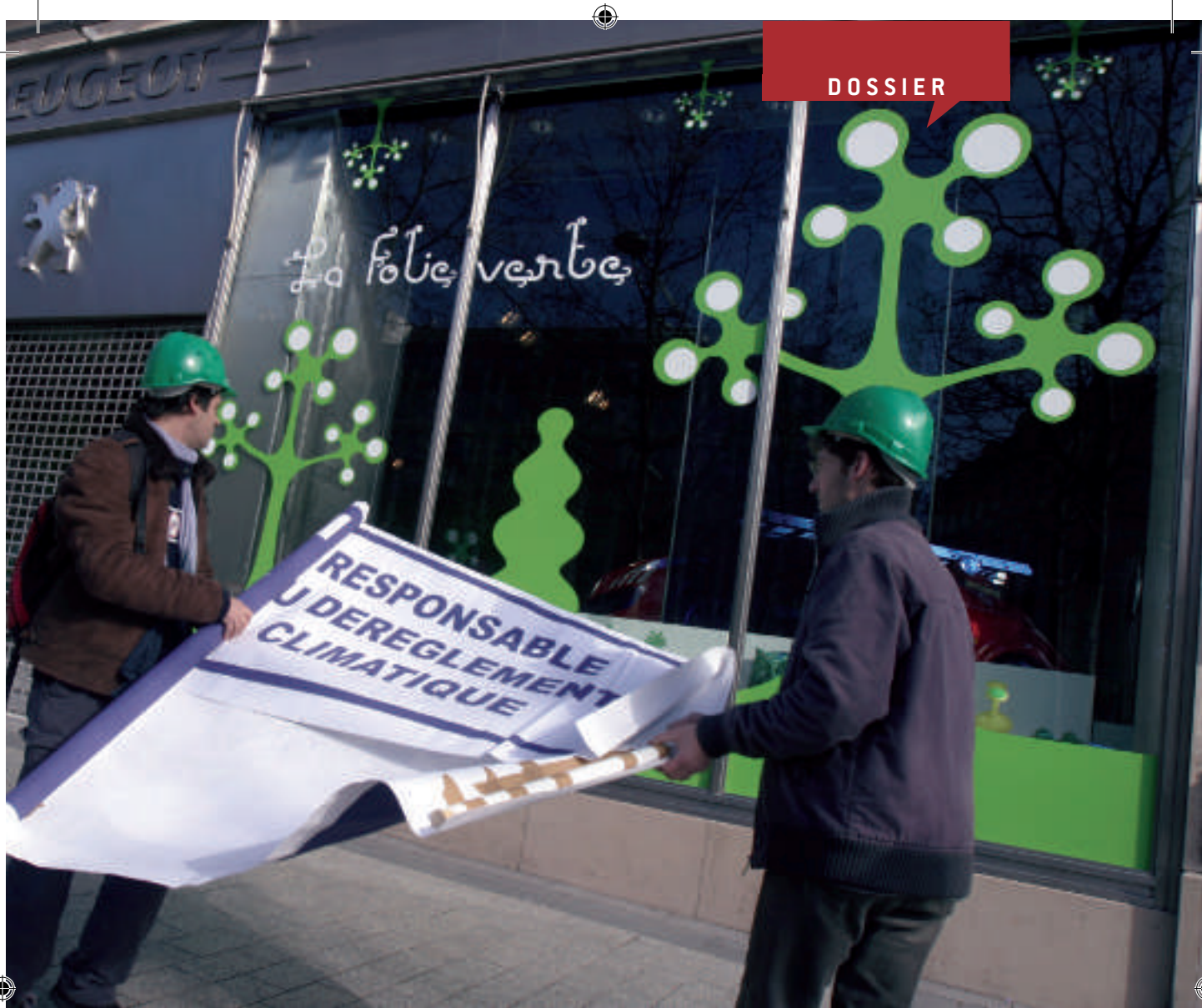
Des militants des Casques verts protestent devant la vitrine d'une concession Peugeot.

nisation reposait essentiellement sur la discipline et la confiance; une personne en recrutait deux autres, et chacune recrutait à son tour deux nouveaux compagnons. Les informations circulaient ainsi de la tête du réseau au bas de la pyramide et inversement; aussi, tout membre arrêté par l'occupant mettait en danger l'organisation tout entière.