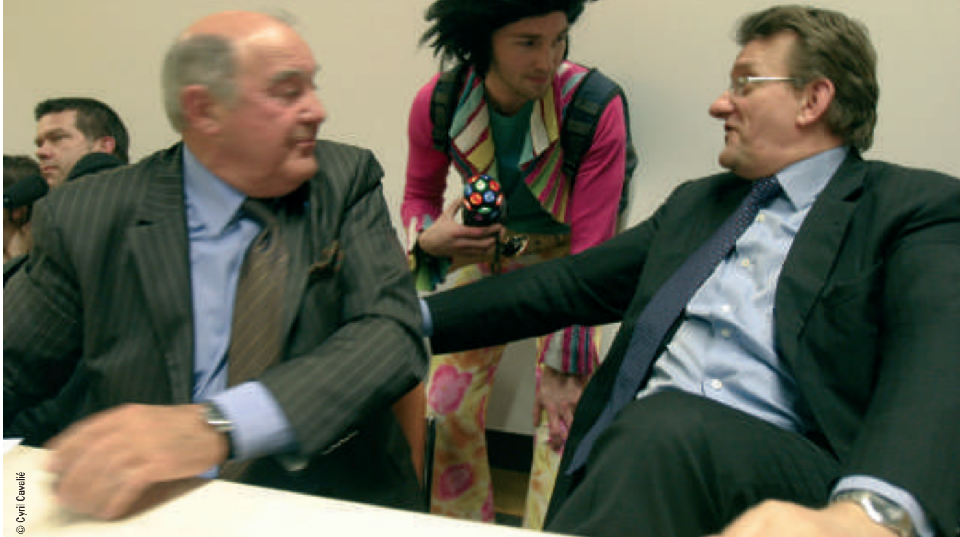
Les militants du collectif Jeudi Noir lors d'une conférence au Salon de l'immobilier.

posés, quant à eux, connected to the World , sont engagés à importer leur impertinence dans le cercle de la tradition habitué aux tracts A4 recto-verso, impertinence apprise dans les luttes sociales (pour la gauche) ou dans les écoles de commerce cool et branchées (pour la droite).