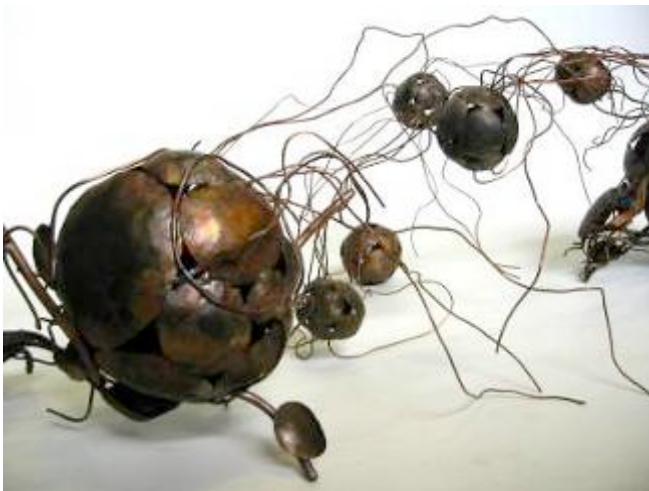
Sculpture Marc Guillermin

Inscription : adada93@free.fr ou Brigitte Romaszko / Alain Jacomy 03 44 82 61 50